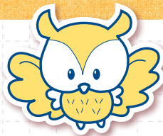
豊島区PRキャラクター 「としま ななまる」