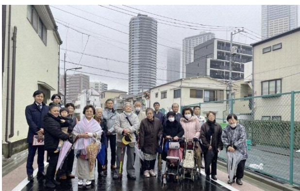
4 世代で沿道にお住まいのご家族も揃って参加してくださいました。

また、今後、防災道路 B3 路線が拡幅整備されると、補助第 81 号線につながる BC 路線が全て 6m 以上の幅員となり、地域の利便性、安全性がより高まります。引き続き、皆様のご理解とご協力をよろしくお願い申し上げます。