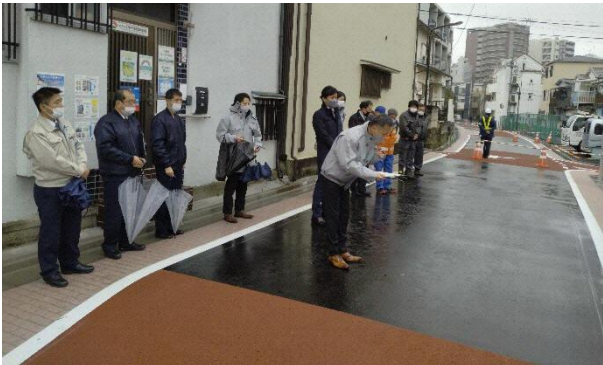
小雨の中、沿道住民と区職員、目白警察、巣鴨警察が集い、開通式を行いました。

日頃より、東池袋四・五丁目地区のまちづくりにご理解とご協力をいただき、ありがとうございます。