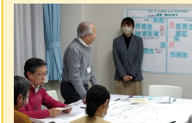
第24回協議会 (令和8年3月12日)

地区ごとの防災上の課題を上げると、お住まいでない隣の地区の課題をお互いに共有することができ、新たな気づきがありました。「ガイドライン」の来年度の完成に向け、長崎1・2・3丁目の課題を広く捉えるなど、引き続き議論を深めて行きます。