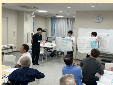
第23回協議会 (令和7年8月8日)

2回に分けて行ったまち歩きでの意見などをもとに、会員の皆さんでグループワークを行い「安全・安心のまち」の実現に向け、様々な角度から意見交換を行いました。防災まちづくりを進める上で、既に他区で実施している「ガイドライン」のような一定の指針の作成が必要であるという意見のもと、「ガイドライン」の作成に向けて取り組むこととしました。