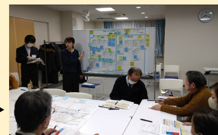
2丁目協議会の様子(令和8年2月18日)▶