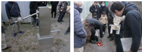
救援センターの防災戸