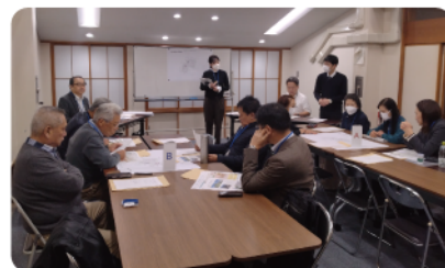
駒込地区防災まちづくりの会の様子

本年度の防災まちづくりの会では、設計内容の確認と意見交換を行いました。また、地域の皆さまに長く親しまれる広場となるよう、呼びやすく愛着の持てる愛称についてアンケートを実施しました。