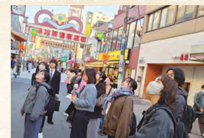
まち歩きで街の魅力を発見

省エネ機器の導入に関する助成金業務で窓口対応があります。助成要件など難しいことも多いので、寄り添いながらしっかりと話を聞きつつ、わかりやすい説明ができるように心がけています。