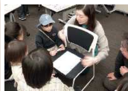
真剣な子どもたちの一筆書き

ブースでは来場した皆さんと一緒にあそび、相手とコミュニケーションをとりながら、皆さんが思う「子どもにとって大切なもの」をリサーチし、ベスト5にシールを貼ってもらいました。