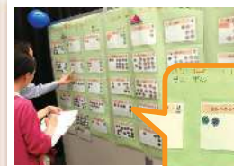
シールが増えました

子どもはビカビカ、大人は銀色シールです。子どもと大人で、ずいぶん考えが違いますね。