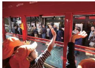
<IKEBUS から手を振る子どもたち>