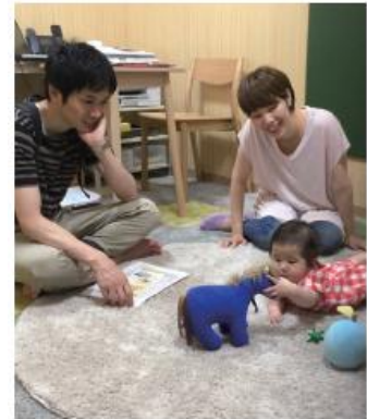
<ゆりかご・としま事業>

目標Ⅱでは、教育や福祉、保健、医療、更生保護などの関係機関が連携し、それぞれの専門性を活かしながら、子どもやその家族が抱える悩み・困難に向き合うことで、個々の発達段階に応じた、切れ目のない継続的かつきめ細やかな支援を行っています。また、全ての家庭が安心して子育てができるよう、子育て家庭への各種支援施策を推進しています。