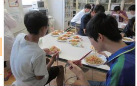
<若者食堂（ジャンプ東池袋）>

目標IVでは、若者に対して、個々の状況に応じて支援を行うことで、日常生活での自立、経済的自立、社会的自立を促進するとともに、若者が社会の一員として能動的に社会参加できるよう、若者の居場所・活動の場の充実や社会参加の推進に取り組んでいます。また、支援が必要な若者について、40歳以降も支援が途切れることがないように、福祉部門と連携して継続的な支援に取り組んでいます。