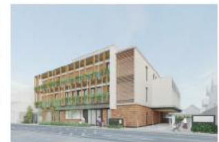
<児童相談所の完成イメージ図>