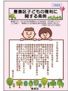
<「豊島区子どもの権利に関する条例」リーフレット>