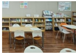
YA図書館 サテライト