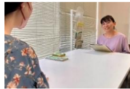
出張アシスとしま 子ども若者総合相談