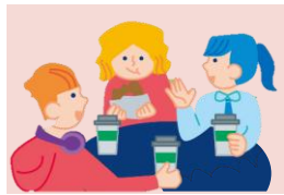
ケアリーバー等の 相互交流