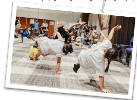
ストリートダンス