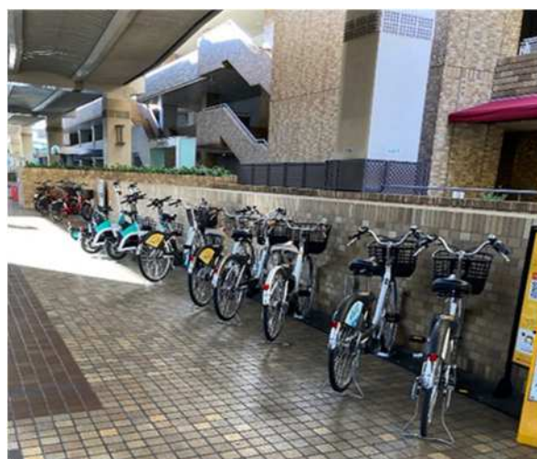
区内のシェアサイクルの展開状況