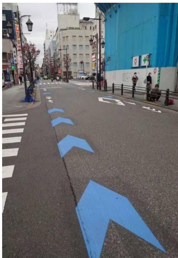
区内の自転車走行空間整備済路線(19路線、5.4 km整備:令和6年度末)