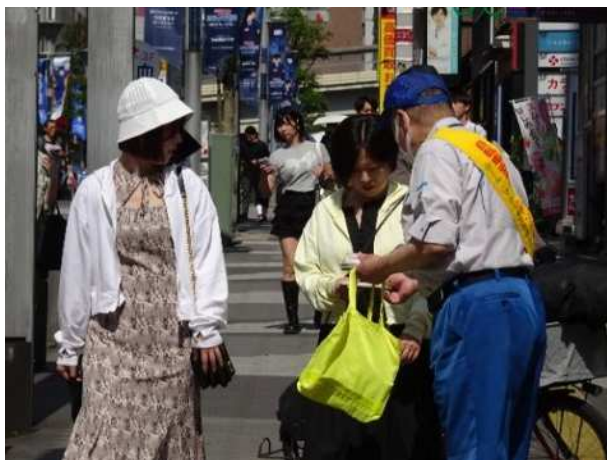
街頭周知啓発活動 (交通安全啓発・放置自転車防止など)