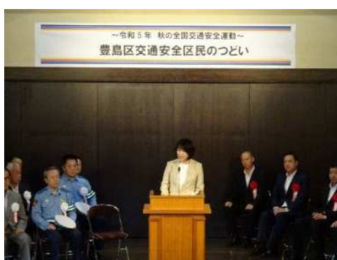
豊島区交通安全区民のつどい