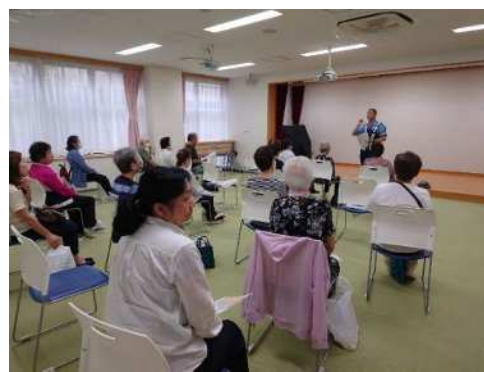
高齢者向け交通安全研修会

※ 令和6年度の交通安全研修会は、全ての「区民ひろば」において延べ46回開催され、高齢者研修会では595人、子育て世代研修会では497人の方が参加されました。