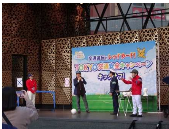
TOKYO 交通安全キャンペーン