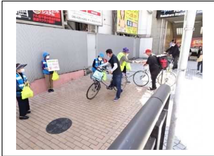
池袋ウイロードでの、区と交通安全協会など交通安全啓発活動