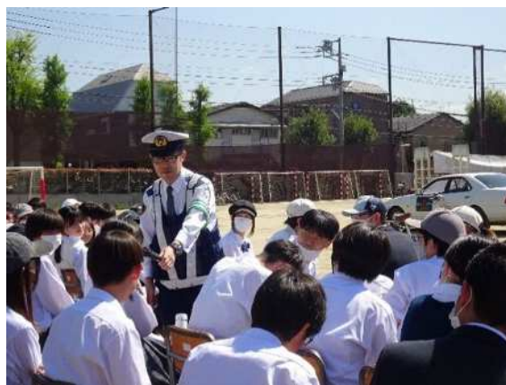
警察官による交通安全授業