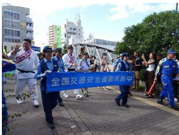
交通安全パレード(目白署)