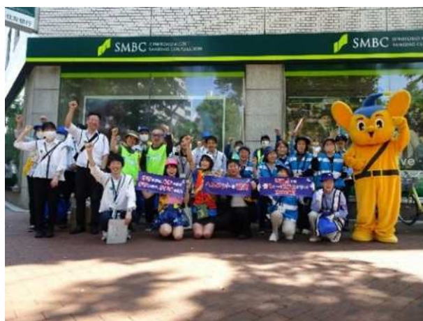
東京都・警察署・地域団体・ 区合同の交通安全啓発活動