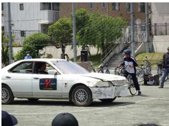
中学生に対する スクエアード・ストレイト自転車交通安全教室