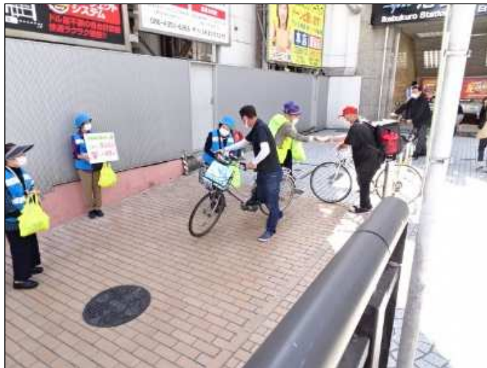
交通安全啓発活動（ウイロード）