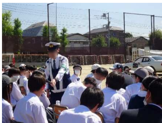
警察官による交通安全授業