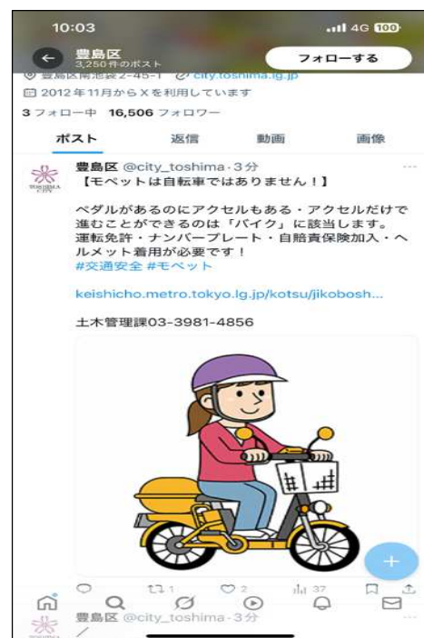
交通安全啓発（ポスター・チラシ・SNS発信）