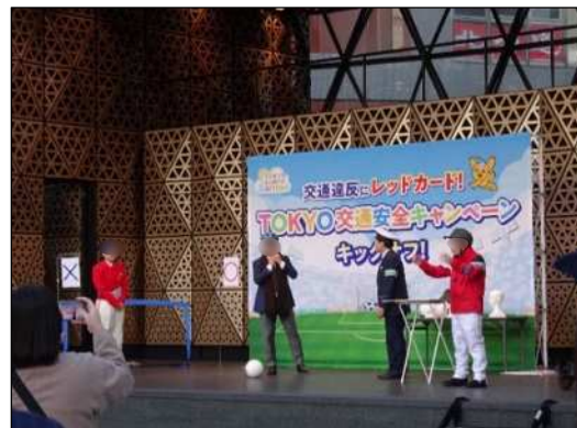
TOKYO 交通安全キャンペーン