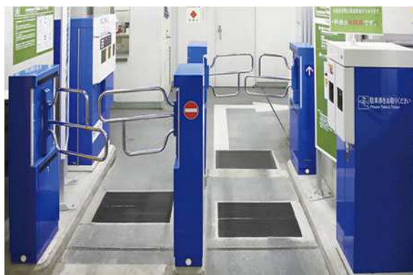
駐輪スペースを通常より広げた「思いやりゾーン」 ゲート入場方式による利便性の高い駐輪場