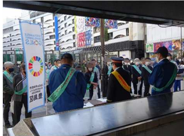
駅前放置自転車クリーンキャンペーン