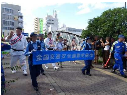
交通安全パレード