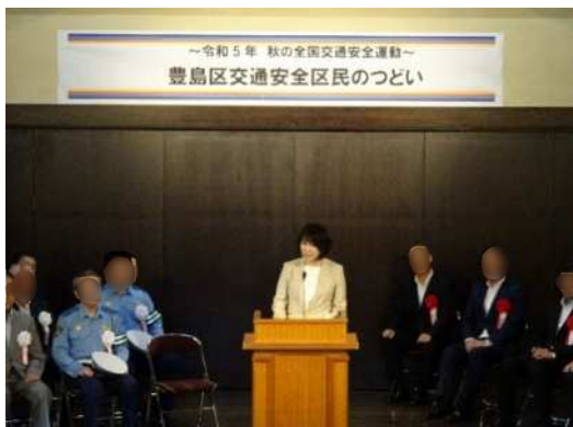
豊島区交通安全区民のつどい