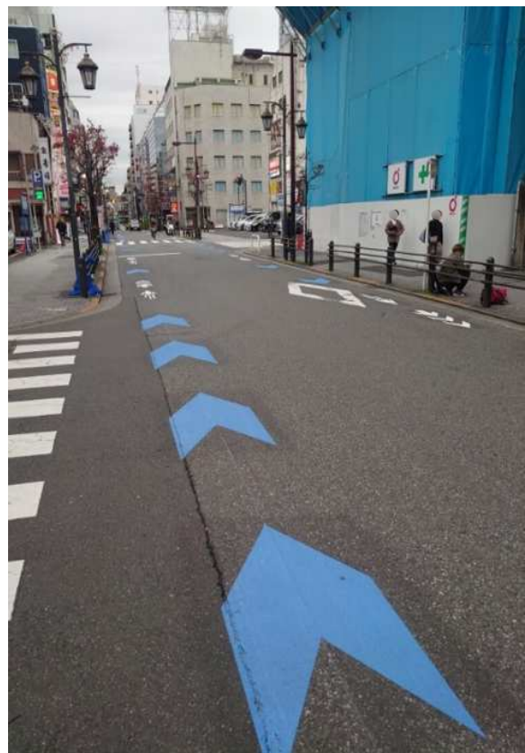
区内の自転車走行空間整備済路線（19路線、5.4km整備：令和6年度末）