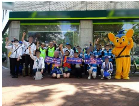
東京都・警察署・地域団体・ 区合同の交通安全啓発活動