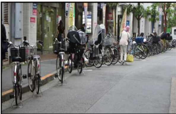
集客施設周辺で放置される自転車