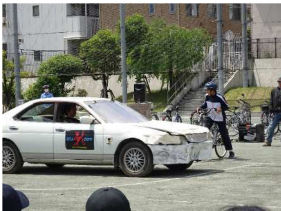
スクエアード・ストリート自転車交通安全教室（中学生）