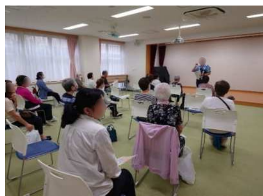
高齢者向け交通安全研修会

※ 令和6年度の交通安全研修会は、全ての「区民ひろば」において延べ46回開催され、高齢者研修会では595人、子育て世代研修会では497人の方が参加しました。