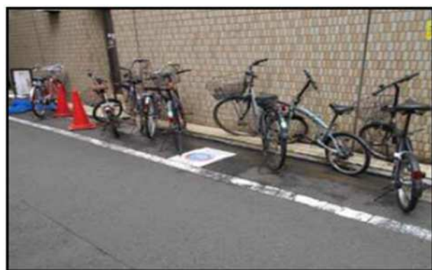
敷地と公道を跨いで放置される自転車