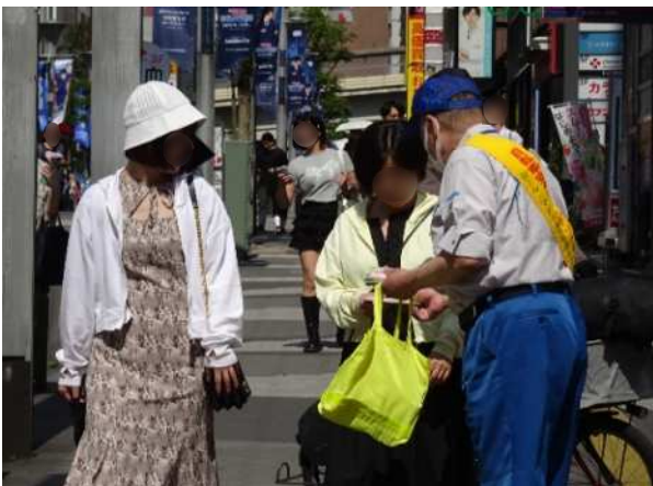
街頭周知啓発活動 (交通安全啓発・放置自転車防止など)