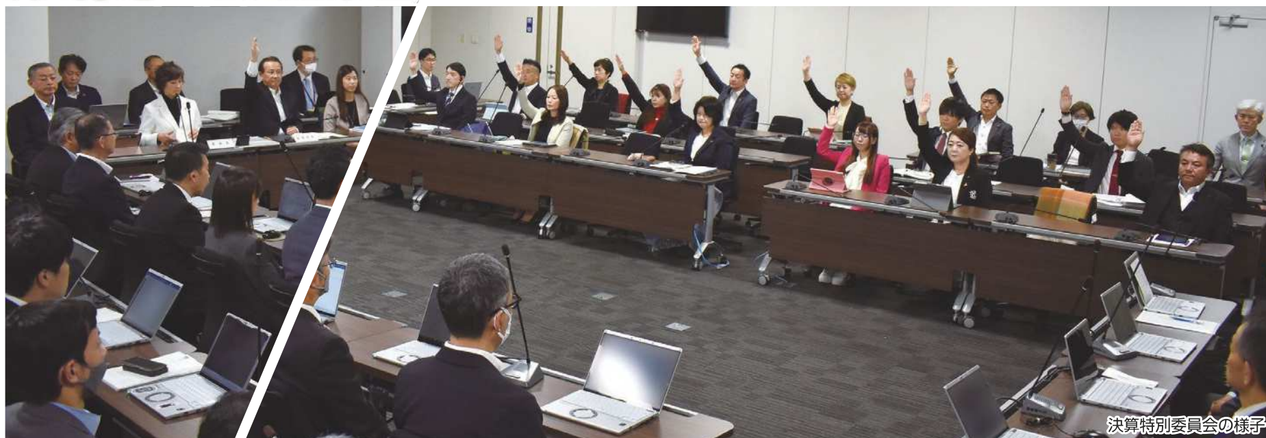
決算特別委員会の様子

令和7年第3回定例会は、9月17日から10月24日までの38日間にわたって開会されました。今定例会では、令和6年度一般会計及び3特別会計決算等の審議が行われ、決算4件を認定したほか、区長提出議案16件を可決、議員提出議案1件を可決、報告1件を了承しました。陳情は、2件を採択、9件を不採択、新たに6件を閉会中の継続審査としました。