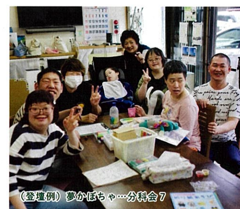
(登壇例) 夢かぼちゃ...分科会7

としまる[Toshima Multicultural Support](豊島区)他