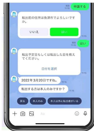
(申請手続きのイメージ)