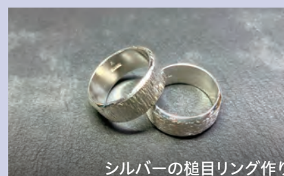
シルバーの槌目リング作り