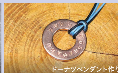
ドーナツペンダント作り