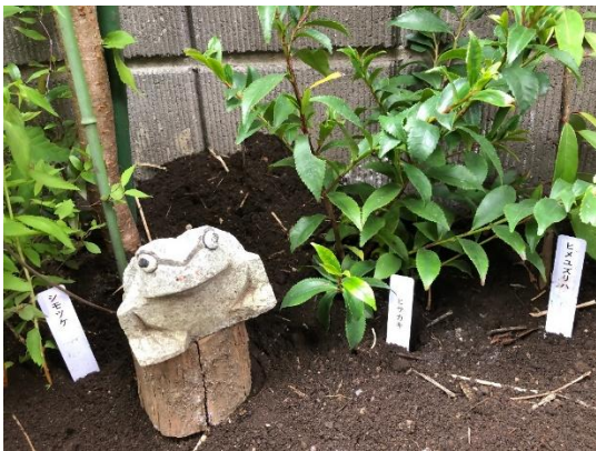
No65 四ツ葉のクローバー