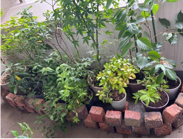
No71 チーム R