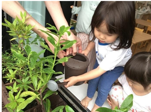
No10 AIAI NURSERY 第二東池袋