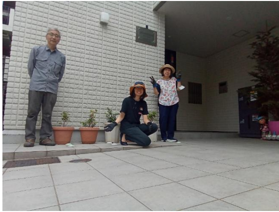
No64 グリーンスプライト