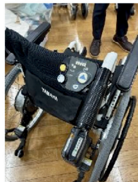
電動車いすの 介助者用アシスト機器