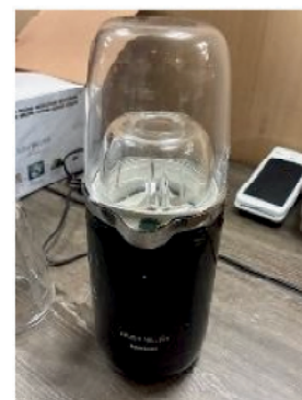
フードプロセッサ