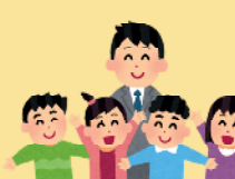
放課後等デイサービス