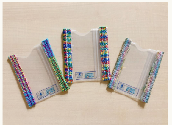
さをり織りケース

豊島区 福祉部 障害福祉課 施設・事業者支援グループ 〒171-8422 豊島区南池袋2-45-1庁舎4階 TEL 03-3981-1786 FAX 03-3981-4303 Mail A0015600@city.toshima.lg.jp