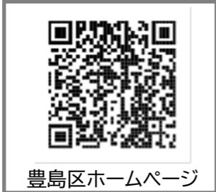
豊島区ホームページ