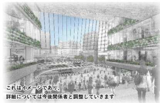
西口（北）の駅まち結節空間