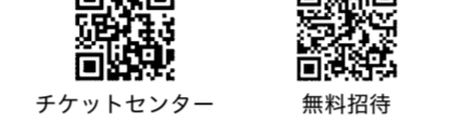
チケットセンター 無料招待

⑨ヴォートル・チケットセンター ☎03 - 5355 - 1280(平日午前10時～午後6時)、無料招待…☎03 - 6455 - 2757(平日午前9時～午後5時)