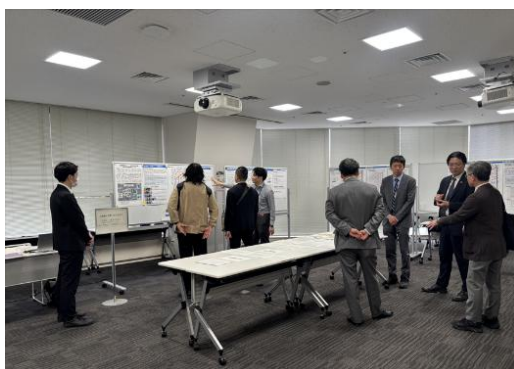
オープンハウス型説明会の様子