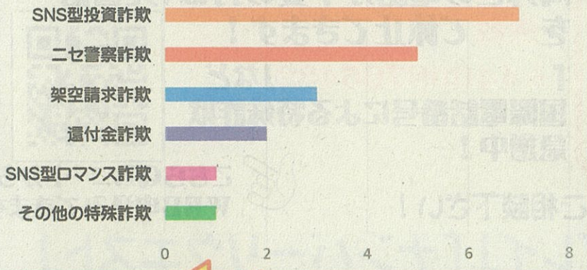
手口別特殊詐欺被害件数 (令和8年1月～4月末)