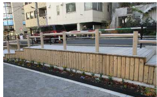
④ 南大塚二丁目児童遊園 【工事後のウッドデッキと協定花壇】