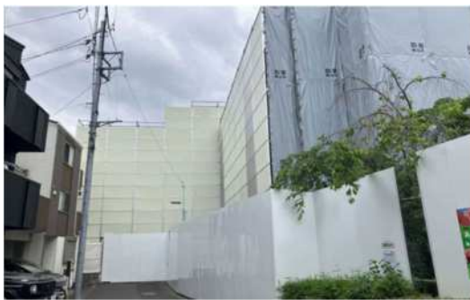
① 上池袋図書館 【奥：防音パネル、手前：防音シート】