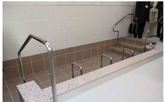
② 長崎第二豊寿園改修後（浴室）