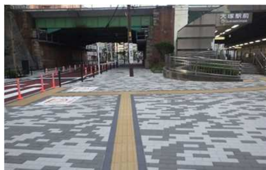
③ 特別区道31-1181拡幅工事 【工事後のインターロッキング舗装】