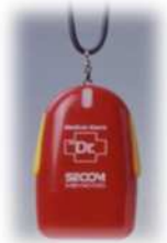
ペンダント型発信機