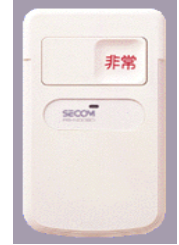
非常ボタン (無線発信機)