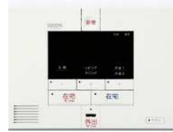
ホームコントローラー (通報装置本体)