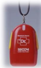
ペンダント型発信機