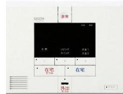
ホームコントローラー (通報装置本体)