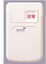
非常ボタン (無線発信機)