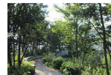
屋上庭園「豊島の森」 Roof Garden, Toshima no Mori

Toshima City Office, completed in 2015, aims to be the most convenient in Japan, with the building's general inquiries and welfare inquiries floors open every weekend (except for the year-end and New Year's holidays and national holidays). Corridor walls in the offices have been transformed into art museums. The building also features a rooftop garden and a digital museum, creating a functional space for residents to gather and relax. The building also has a variety of environmentally friendly ecosystems. The offices are also a state-of-the-art integrated disaster reduction system, acting as a command post in the event of a disaster.