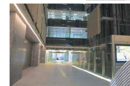
1階から9階まで、吹き抜け空間になっているアトリウム