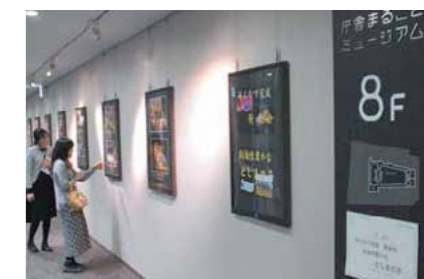
回廊がある構造を生かし、庁舎を丸ごと「美術館・博物館」に見立てたミュージアムな空間

屋上にかつての豊島区の自然を再現。荒川水系のいきものを観察できる水槽やビオトープも設けています。