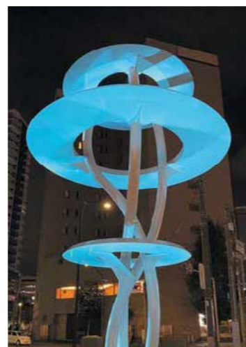
四季折々に異なる色合いを演出します。